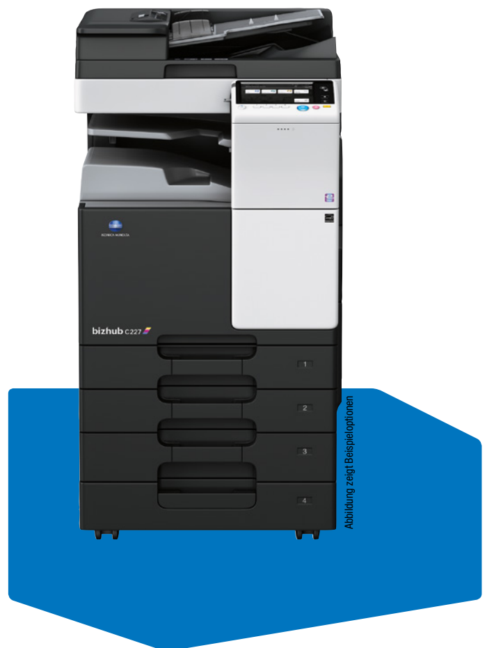
Abbildung zeigt Beispieloptionen

Arbeiten Sie auch im Büro äußerst professionell.